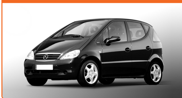
MERCEDES-BENZ A W168