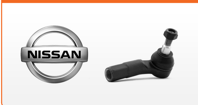
KONCOVKY KLOUBŮ TÁHLA ŘÍZENÍ PRO NISSAN