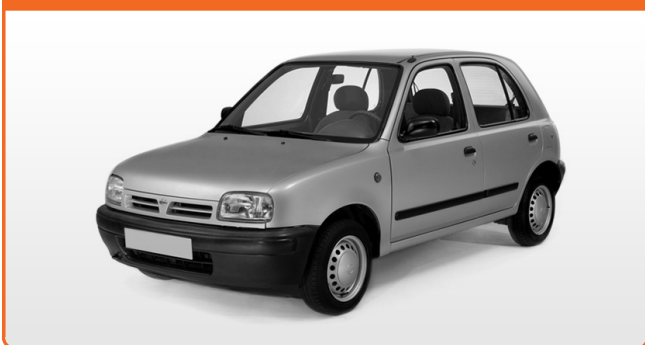
NISSAN MICRA K11