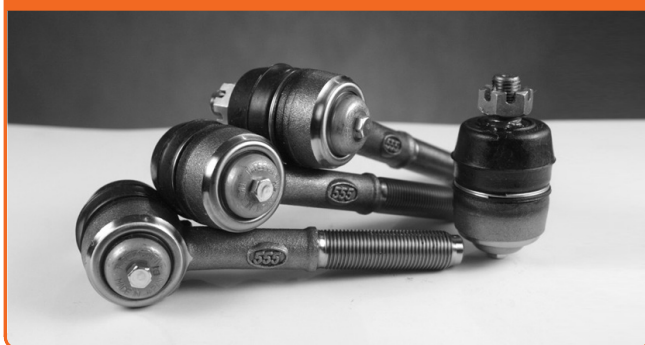
KONCOVKY KLOUBŮ TÁHLA ŘÍZENÍ