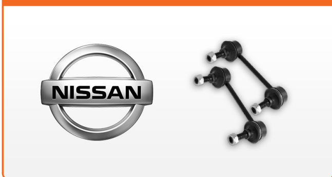
STABILIZAČNÉ RAMENÁ PRE NISSAN