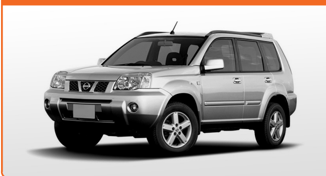
NISSAN X-TRAIL T30