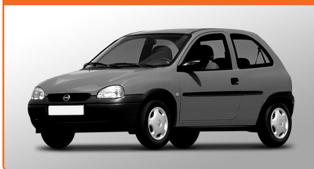
OPEL CORSA B