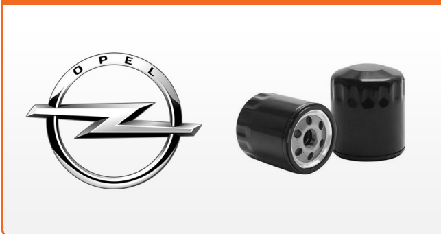
OLEJOVÉ FILTRE PRE OPEL