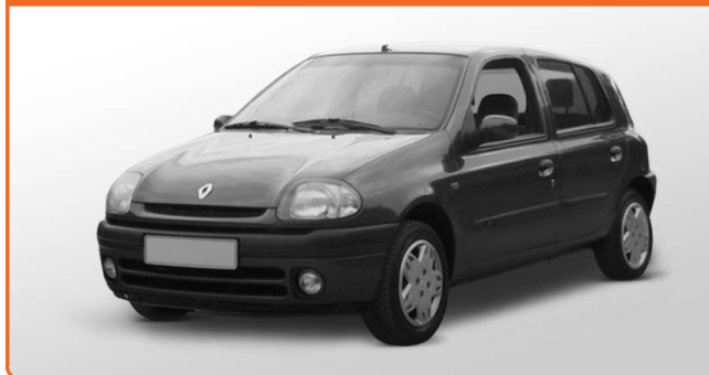
RENAULT CLIO II