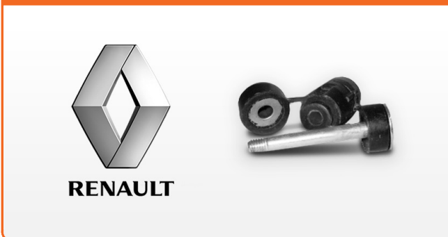
STABILIZAČNÍ RAMENA PRO RENAULT